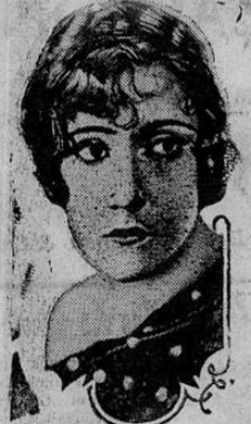
Gloria Swanson in the

Esta disposición de aquella Municipalidad quizá cuente con la aprobación de los vecinos; pero como a la desgracia se le ocurre lo mismo, tendría una protesta general; o que más impuestos y sin agua, sería el colmo.